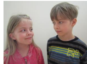
Tvíburar í Havn 2014